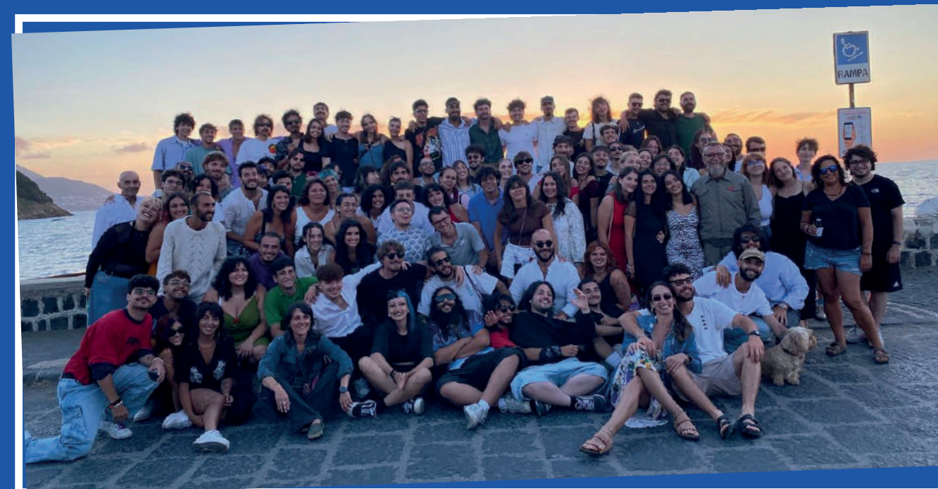
NOI UMANI, 2024

che, abbandonando la produzione di oggetti tipicamente estetici, si adoperano per avvalersi di dispositivi in grado di attivare la creatività del pubblico trasformando un oggetto d'arte in un luogo di dialogo, confronto e di relazione in cui perde importanza l'opera finale e assume centralità la scoperta, il processo, l'incontro.